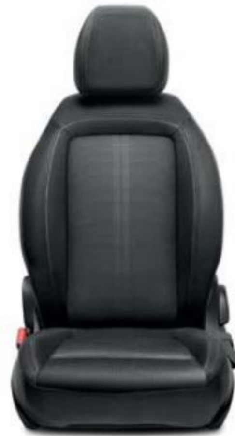
015 בד אפור משולב שחור